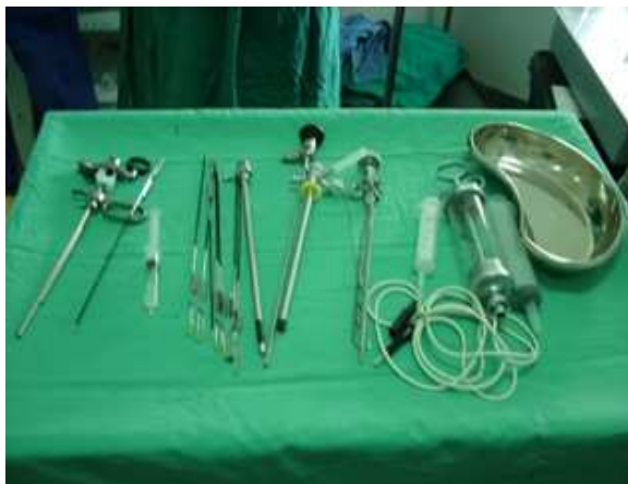
Kit per resezione endoscopica prostata

Lo strumentario endourologico, corredato da presidi medico-chirurgici dedicati, è stato portato dal Team per favorire le tecniche endoscopiche e a tal proposito è stato illustrato sia nella tecnica che nell'uso al personale locale.