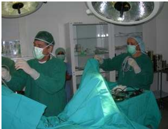
Preparazione campo operatorio per intervento endoscopico